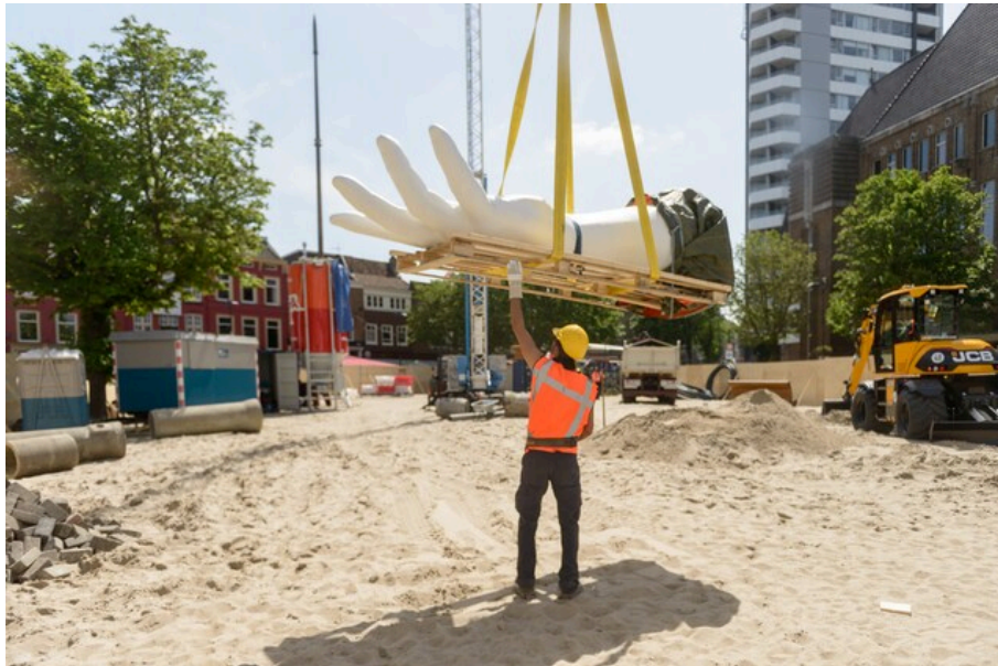
De 'bouwplaats' van Sic transit gloria mundi Beeld Foto's Willem Popelier, JA Architectura

Ik vermoed dat het relletje Verhoeven teleurstelde. Maak je een kunstwerk dat gaat over het einde van de westerse wereldmacht, gaat de ophef over pils. Of je kunt het ironisch opvatten: terwijl Verhoeven suggereert dat heersende westerse waarden passé zijn, staan boze ondernemers en consumenten op de bres voor hun recht op lichtzinnig vermaak en economisch gewin.