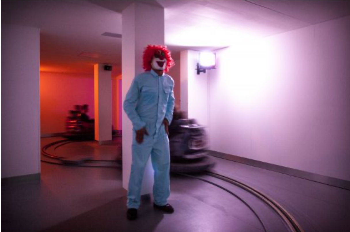
I huset løber klovne rundt efter vognene

Foto: PR-photo / Phobiarama by Studio Dries Verhoeven - Willem Popelier