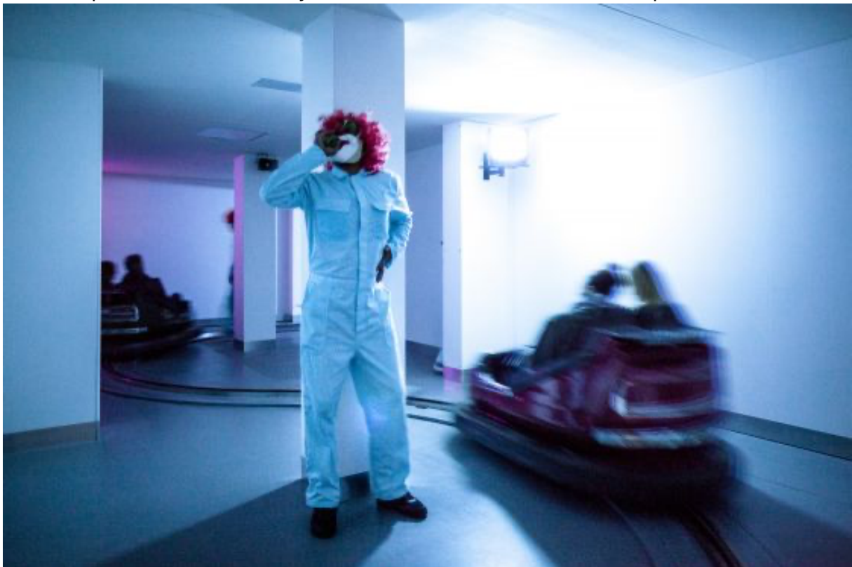
Foto: PR-photo / Phobiarama by Studio Dries Verhoeven - Willem Popelier

Phobiarama griber ind i den aktuelle frygtkultur