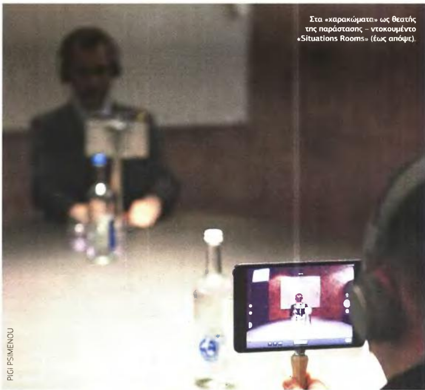
Στα «χαρακώματα» ως θεατής της παράστασης - ντοκουμέντο «Situations Rooms» (έως άποψη).

Κι όμως είναι αυτός ο ξένος που θα σου εκμυστηρευτεί τον, μπροστά στα μάτια του, βιασμό της μικρής